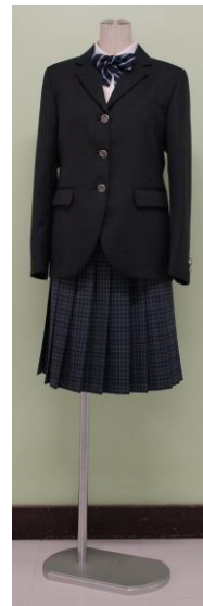
チェックの スカート